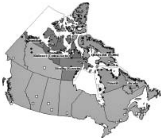
Le territoire inuit représente le tiers de la masse continentale du Canada.