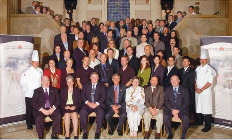
La délégation canadienne pose pour une photo de groupe lors de la 2 e mission d'Équipe Canada Atlantique à Chicago.

Chicago, Illinois > Équipe Canada Atlantique (ECA), fruit d'un partenariat entre des ministères fédéraux et les quatre provinces de l'Atlantique, a organisé en octobre une mission commerciale très réussie sur le marché du grand Chicago. Cette mission fait suite à une 1 re mission qui s'était déroulée en avril 2005 et qui avait également remporté beaucoup de succès.