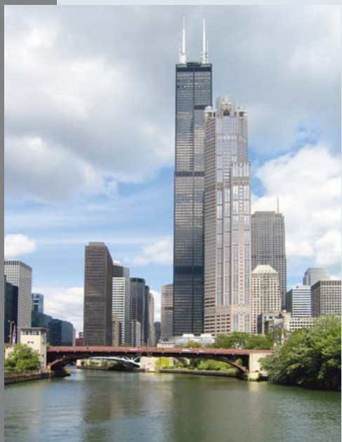
L'incomparable tour Sears, située en plein cœur du quartier des affaires de Chicago.

Chicago est le cœur des affaires des États-Unis. Elle est la 3 e ville en importance aux États-Unis (derrière Los Angeles et New York) et compte 9,1 millions d'habitants. Ville affairée, où les journées n'ont que 24 heures comme ailleurs, ses deux aéroports gèrent 3 200 vols par jour, soit 88 millions de passagers par an! Elle a tout : théâtres, architecture de premier ordre, équipes sportives professionnelles, festivals, sites historiques, collections d'œuvres d'art exceptionnelles, attractions naturelles et artificielles, et bien plus encore.