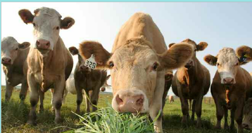
Prenez un numéro pour vous faire servir.

« L'une des grandes priorités commerciales du gouvernement est de trouver une solution au problème de l'accès du bœuf et des bovins qui soit fondée sur des principes scientifiques objectifs, a affirmé David Emerson, ministre du Commerce international. C'est donc là une étape