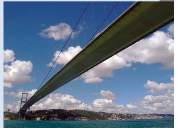
Pont enjambant le Bosphore, à Istanbul.

Cette conférence, durant laquelle des entreprises canadiennes ayant déjà connu du succès dans la région exposeront leurs expériences, coïncidera avec la visite en Amérique du Nord d'un groupe de gens d'affaires turcs. La conférence est organisée avec le soutien de Commerce international Canada, d'Affaires étrangères Canada et d'Exportation et développement Canada (EDC). De concert avec des institutions financières internationales, EDC y participera et traitera de stratégies de financement liées à l'entrée sur ce marché. On y présentera une évaluation juste des possibilités dans une région offrant des débouchés considérables. Afin de favoriser l'échange de vues, le nombre de places sera limité.