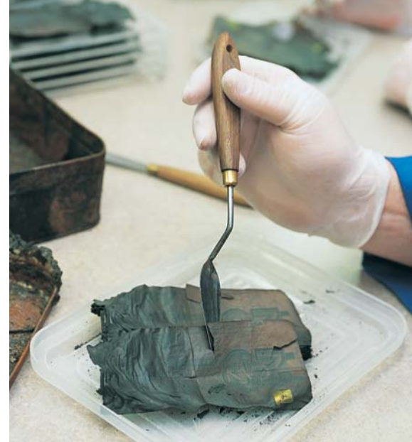
Les billets calcinés sont examinés attentivement au Service des billets mutilés. Chaque année, la Banque est appelée à déterminer, aux fins de leur remboursement, la valeur des billets brûlés, décomposés, déchirés, déchiquetés ou contaminés.

Les billets de banque ont une durée de vie limitée. La Banque du Canada est chargée de la destruction et du remplacement des billets usés. Lorsque les institutions financières lui retournent des billets, elle repère ceux qui sont impropres à la circulation et les envoie dans des sites d'enfouissement après les avoir déchiquetés.