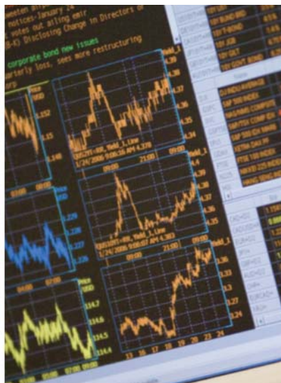
La salle des marchés de la Banque