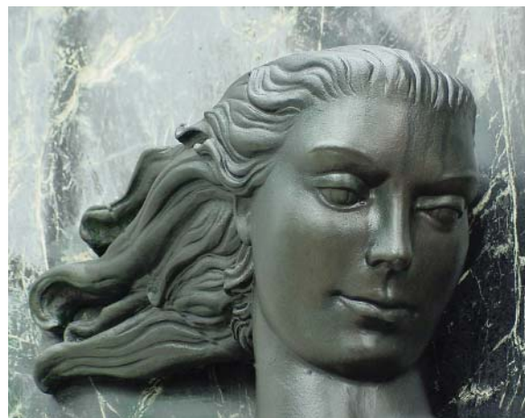
Détail du panneau en bronze sur la façade de l'immeuble du siège

les chefs de département et le directeur des ressources humaines.