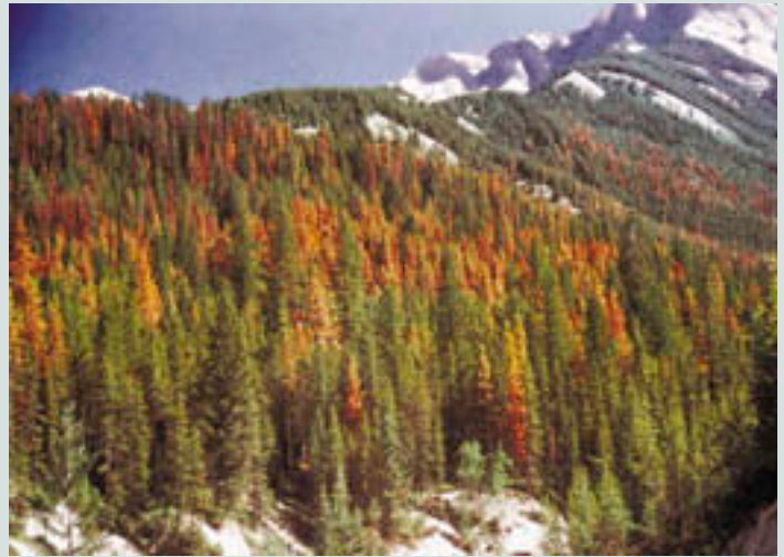
Ressources naturelles Canada, Service canadien des forêts

Les bioraffineries peuvent être de géométrie variable, car elles tiennent compte des coûts de transport des matières brutes, du besoin de fournir des emplois et des possibilités au niveau local pour les investisseurs locaux et les coopératives agricoles, mais aussi des économies d'échelle. Par conséquent, bon nombre d'entre elles sont situées dans les régions rurales, contribuant ainsi directement aux économies des petites collectivités. D'autres sont implantées à grande échelle pour assurer la complexité technique et la rentabilité