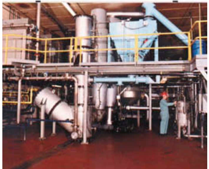
Usine commerciale de traitement thermique rapide de la société Ensyn

Notre préoccupation est que la transition mandatée vers les biocarburants au Canada et dans les autres pays de l'OCDE puisse devenir une nouvelle forme de subvention agricole rurale dans les pays riches et que, malgré le soutien des prix et les allègements fiscaux offerts au nom de la protection environnementale, elle ne puisse être ni rentable ni utile dans la promotion de la meilleure technologie à long terme. Nous ne croyons pas qu'il soit dans les intérêts à long terme du Canada pour les collectivités agricoles