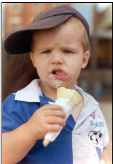
Photographer: Mireille Bourgeois Collège d'Artisanat et de Design du Nouveau Brunswick

Auriez-vous l'obligeance de nous le faire savoir si vous changez d'adresse? Ainsi, nous pourrions continuer à vous faire parvenir les dernières nouvelles. Communiquez avec Susan McKellar pour lui faire part de vos nouvelles coordonnées – téléphone : (819) 953-8101; courriel : susan.mckellar@spg.org