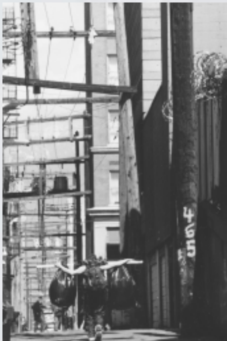
Allée typique du Downtown Eastside.

Le projet BEACON (Building Education and Culture in Our Neighbourhood) (promouvoir l'éducation et la culture dans notre