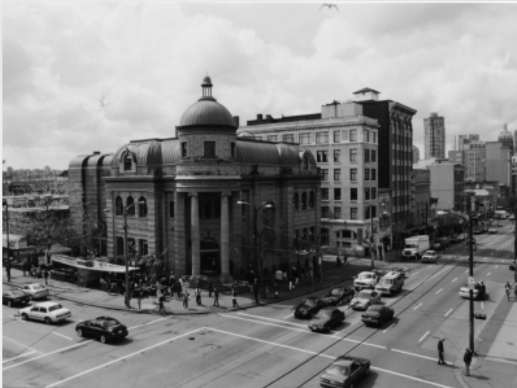
Carnegie Centre au coin de Main et Hastings – une des intersections les plus connues du cœur du Downtown Eastside de Vancouver.

Ces initiatives permettront de poursuivre les progrès déjà réalisés par l'Accord de Vancouver dans les domaines du développement économique et de l'amélioration des quartiers, des logements, de la santé et de la sécurité.