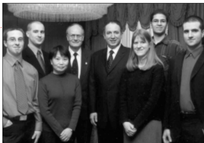
Tom Brzustowski, président du CRSNG, et Maurizio Bevilacqua, alors secrétaire d'État (Sciences, Recherche et Développement), lors de l'annonce de l'octroi des bourses du CRSNG de 2002 qui a été faite le 27 mars dernier. Ils sont en

Les bourses du CRSNG sont décernées à quelques-uns des jeunes chercheurs canadiens les plus brillants – des individus qui aideront grandement à atteindre les objectifs en matière de personnel hautement qualifié (PHQ) établis dans la Stratégie d'innovation du Canada.