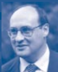
L'Honorable António Vitorino Commissaire, Justice et Affaires intérieures Commission européenne

L'INTÉGRATION des migrants, à la fois économique et humanitaire, représente un défi de taille pour nos sociétés. En réalité, la réussite de notre politique en matière d'immigration dépendra de la réussite de nos politiques en matière d'intégration. Nous devons construire un contrat de valeurs entre nos sociétés et les communautés ethniques qu'elles reçoivent. C'est là une question qui nous touche tous.