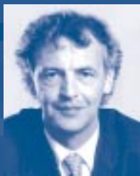
Roger Van Boxtel ministre des Politiques urbaines et de l'intégration des minorités ethniques aux Pays-Bas

D ÉPUIS les événements du 11 septembre, les nuances semblent avoir disparu de plusieurs sociétés européennes, incluant les Pays-Bas – disparu derrière un mur de peur et d'ignorance, d'inimitié et d'aliénation. Certains groupes de notre société se sentent singularisés. Ils se démènent pour reprendre leur place, dans toutes leurs diversités.