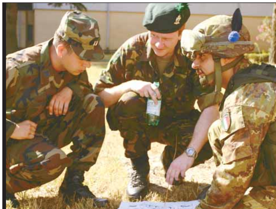
Part of the real life session of the YROW, participants go over a plan of attack when they discover suspected terrorists are holding hostages in a vacant building.