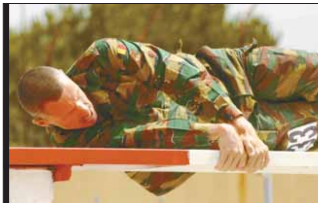
A member of the German Army tackled the obstacle course part of the CIOR Military Competition in Viterbo, Italy July 5. The Canadian Novice team took first place in their division of the competition.

Not only do they compete physically, these reserve officers get to interact with soldiers from other countries and discuss and witness how they train and work, and take the lessons learned back home to their units and their troops.