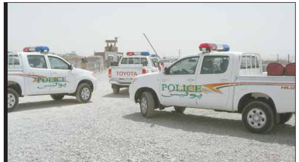
CPL ROB MUGRIDGE

The role of the KPRT's Canadian police is to assist in building the capacity of local Afghan police forces. The civilian police are establishing relationships and serve as a focal point between the KPRT and the ANP. They also advise, mentor, monitor and train Afghan police, working in close co-operation with Germany (as lead nation for police reform) the US and other international agencies.