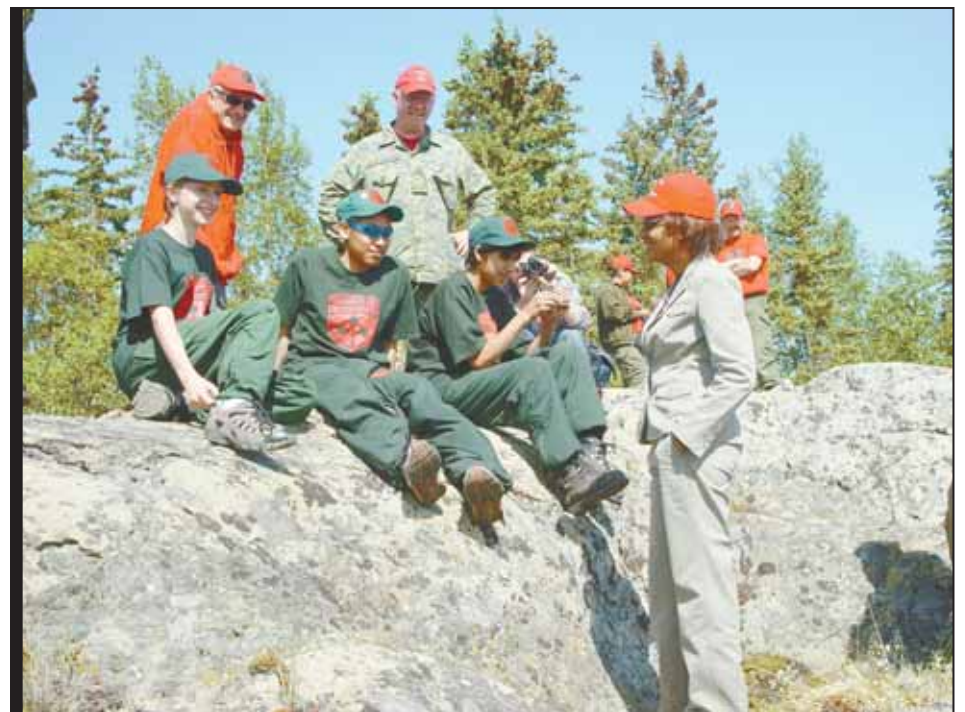
Governor General Michaëlle Jean chats with Junior Canadian Rangers from Tulita and Kugluktuk during her visit to the Northwest Territories.

Le groupe s'est installé sur les pierres où brillait le soleil et où la brise éloignait les moustiques. M me Jean a donc pu déguster les mets du Nord du Canada et discuter avec les Rangers.