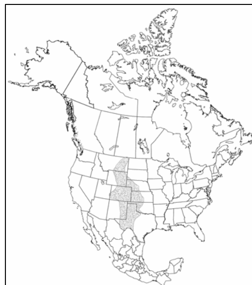
Figure 4. Aire de répartition connue de la cryptanthe minuscule en Amérique du Nord (d'après Alberta Sustainable Resource Development, 2004).

À l'échelle mondiale, la cryptanthe minuscule est jugée demonstrably secure under present conditions