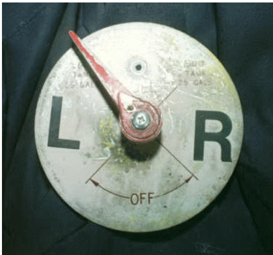
Figure 1 – Sélecteur de réservoir enclenché dans le cran de gauche

Le sélecteur de réservoirs de carburant comporte des positions ON, l'une pour le réservoir de droite et l'autre pour le réservoir de gauche, chacune située à un angle de 45 degrés au-dessus