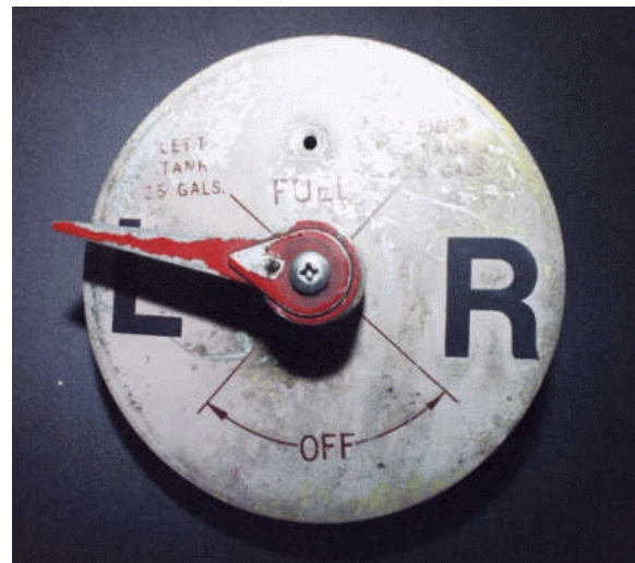
Figure 2 – Sélecteur de réservoir sur L, non enclenché dans le cran

de l'horizontale, ainsi que deux positions OFF situées, à droite comme à gauche, à un angle de