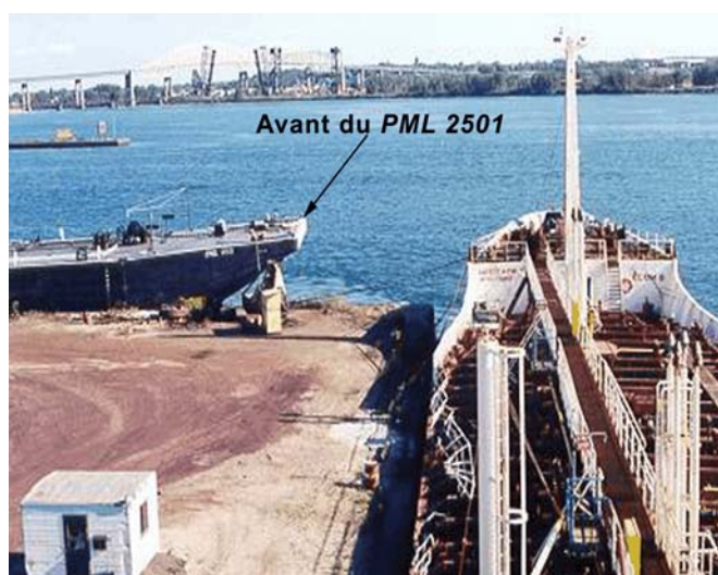
Photo 1. Vue vers l'avant à partir de la passerelle du Coral Trader .

Le Coral Trader est un navire de haute mer de transport de produits chimiques. La passerelle, les emménagements et la salle des machines sont situés à l'arrière des citernes à cargaison. Le navire est muni d'un seul gouvernail et sa machine principale entraîne une hélice à pas variable à gauche. Il était amarré en direction sud le long du côté ouest et à la limite sud du quai de l'Algoma Steel Corporation. Il devait descendre le courant en passant par les écluses du canal de Sault Ste. Marie