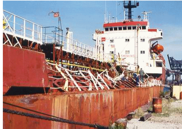
Photo 3. Avaries au côté bâbord du Coral Trader

Comme le chaland PML 2501 est toujours retenus par des amarres, il se retrouve plus en avant que son poste à quai d'origine, tandis que le Coral Trader se déplace vers l'arrière; toutefois, l'avant du chaland finit par se retrouver tout contre le quai.