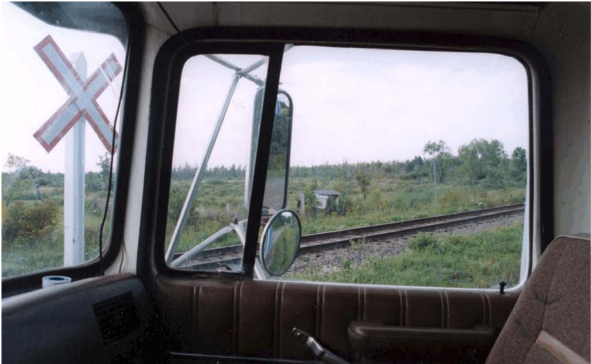
Photo 3. Voie ferrée vue en direction est à partir du siège du conducteur