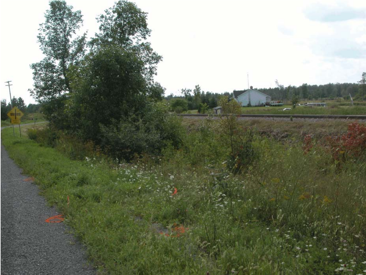
Photo 1. Vue du côté droit des abords du passage à niveau de Kettles Road à partir du siège du conducteur d'un véhicule

La locomotive a subi des avaries mécaniques considérables, notamment au chasse-neige/chasse-pierres, au longeron latéral, aux portes latérales et au câblage électrique. L'examen fait après l'accident a révélé qu'en raison de la force de la collision, le rail nord du passage à niveau avait été déplacé d'environ 1½ pouce (4 cm) vers l'intérieur.