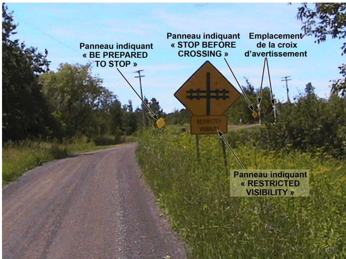
Photo 2. Signaux du plan de signalisation 2 installés aux abords du passage à niveau croisant la route à un angle aigu

Des signaux avancés de passage à niveau avaient été installés en 1992 aux abords du passage à niveau. Il s'agissait de signaux conformes au plan de signalisation 2 du ministère des Transports de l'Ontario (MTO), qui indiquaient dans l'ordre : Restricted Visibility, Be Prepared to Stop et Stop Before Crossing (voir la photo 2) (Visibilité réduite, Soyez prêt à arrêter et Arrêtez avant de traverser). Les signaux, qui devaient aviser les automobilistes des mesures à prendre, avaient été installés provisoirement et devaient être retirés après qu'on aurait fait des améliorations permanentes au passage à niveau. Ces signaux d'avertissement ne sont pas des panneaux de réglementation, en ce sens qu'ils n'ont aucun caractère exécutoire. Les signaux du plan de signalisation 2 consistent en des losanges portant des indications et des lettres noires sur fond jaune. Alors que la mention ajoutée au bas du premier des trois signaux indiquait correctement que la visibilité était réduite, le graphique apparaissant sur le signal montrait que le passage à niveau était perpendiculaire aux abords routiers. Il existe des signaux avancés pour représenter des passages à niveau qui croisent la chaussée à un angle aigu.