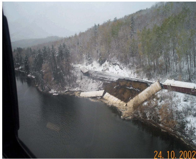
Photo 1. Vue des wagons déraillés

photo 1). Les wagons déraillés ont subi des dommages et la voie a été détruite sur une distance de 275 m. Une digue a été érigée autour des wagons déraillés afin de récupérer le minerai et de nettoyer le lieu de l'accident.