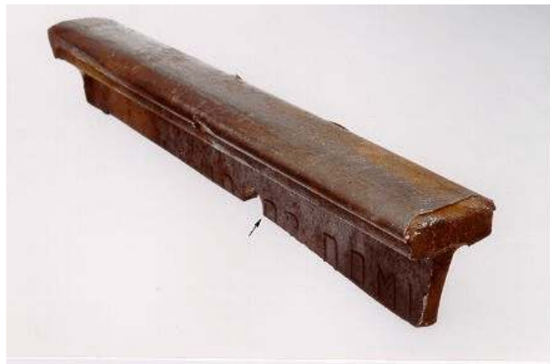
Photo 2. Trou de boulon d'éclisse et rupture de l'âme

Le premier morceau de rail avait une rupture longitudinale de l'âme qui traversait un ancien trou de boulon d'éclisse percé dans l'âme du rail et coupant le chiffre « 0 » du marquage en relief du rail (voir la photo 2). Le trou ne présentait pas d'usure ni d'ovalisation inhabituelles et ses bords n'étaient pas chanfreinés. L'analyse métallurgique d'une section prélevée sur le bord du trou a révélé une décarburation de la surface du métal. La surface de rupture était relativement plane et uniforme. Elle présentait une déformation du grain et une fissuration sous-jacente correspondant à une usure à long terme par martèlement.