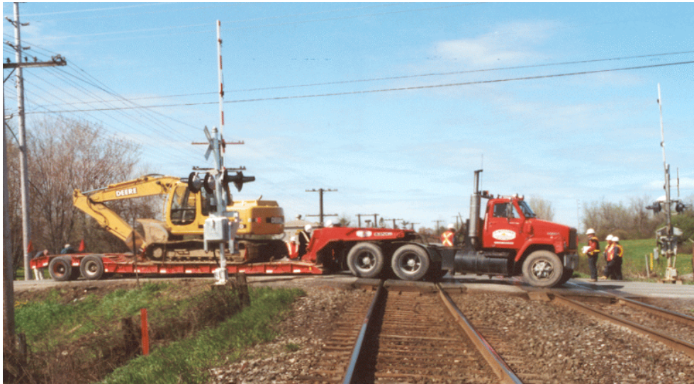
Photo 1. Simulation d'un camion traversant les voies au point de contact avec la chaussée