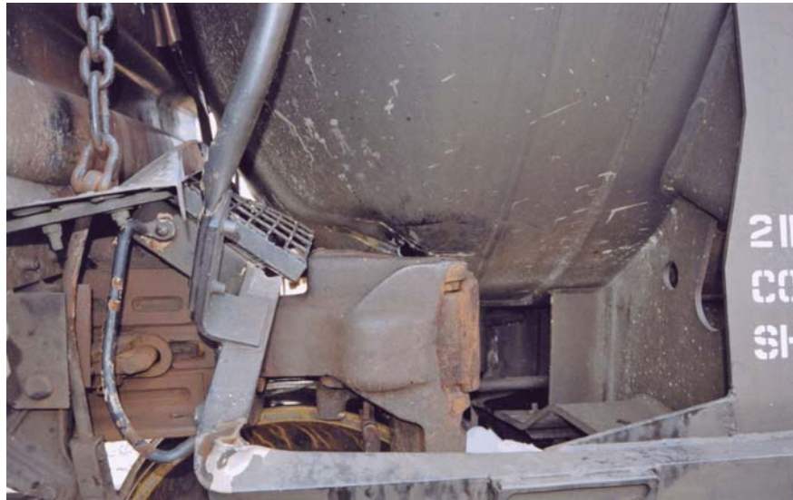
Photo 1. Attelage du wagon couvert CN 557596 et perforation subie par le wagon-citerne ADMX 29571

Les enquêteurs n'ont pas relevé de dommages antérieurs au déraillement sur le matériel roulant et n'ont pas relevé de dommages à la voie ferrée. Ils ont noté que le robinet d'arrêt situé au bout B du wagon couvert était fermé complètement (voir la photo 2).