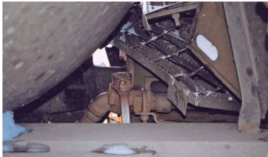
Photo 2. Robinet d'arrêt fermé du wagon couvert CN 557596

Les enquêteurs n'ont pas relevé de dommages antérieurs au déraillement sur le matériel roulant et n'ont pas relevé de dommages à la voie ferrée. Ils ont noté que le robinet d'arrêt situé au bout B du wagon couvert était fermé complètement (voir la photo 2).