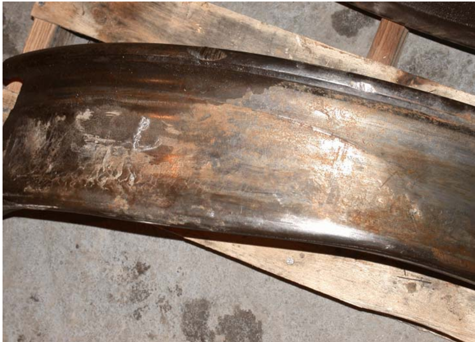
Photo 3. Déformation plastique de la table de roulement de la roue L2

Elle présentait aussi des écaillages dans la zone déformée, mais ces écaillages ne dépassaient pas les limites admissibles de l'AAR. La roue opposée de l'essieu comportait également une déformation plastique d'une largeur d'environ 0,23 pouce et d'une longueur de 5,5 pouces. Il n'y avait aucun signe de décoloration ou de brûlure observé sur la table de roulement des roues (voir la photo 3).