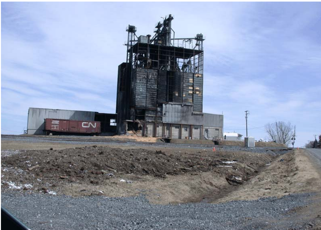
Photo 1. Façade endommagée de la meunerie (photo prise deux mois après l'accident)

Le wagon WC 65061 est immédiatement suivi de trois autres wagons chargés de ferraille puis des wagons-citernes CGTX 64270 et GATX 9200 qui contiennent du propane ainsi que du wagon-citerne PROX 83006 qui contient du chlore. Le wagon-citerne CGTX 64270 prend feu et explose, endommageant la meunerie, qui est déserte au moment de l'accident (voir la photo 1). Le wagon GATX 9200 et le wagon PROX 83006 sont lourdement endommagés et touchés par le feu, mais ne perdent pas leur chargement. Les autres wagons contenant des marchandises dangereuses (hydrocarbures, UN 1863) sont parmi les derniers à dérailler; ils subissent des dommages mais ne sont pas touchés par le feu et ne perdent pas leur chargement.