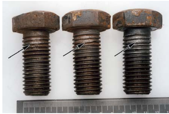
Photo 4. Usure par frottement sur les filets des vis de blocage

En mars 2006, le CN a entrepris une enquête dans son atelier de roues de Transcona au Manitoba pendant deux semaines afin d'évaluer la proportion du parc encore équipée de joints d'étanchéité à vis de blocage. Le CN a indiqué que, sur un total de 2221 essieux montés (CN et étrangers) reçus à l'atelier, 8 essieux montés au total comportaient des roulements à rouleaux munis de joints d'étanchéité en caoutchouc. Ce chiffre correspond à environ 0,36 % de tous les essieux montés qui arrivent à l'atelier. Étant donné la taille de l'échantillon, le CN considère ce pourcentage valide du point de vue statistique. Le CN a également indiqué que, parmi les roulements examinés dont on soupçonnait une surchauffe, le pourcentage de roulements munis de joints d'étanchéité en caoutchouc a diminué régulièrement chaque année, comme le montre le tableau ci-dessous :