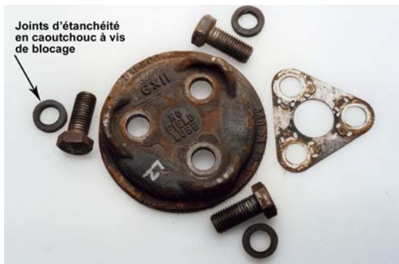
Photo 2. Joints d'étanchéité en caoutchouc à vis de blocage avec les vis de blocage, le capuchon d'extrémité et la plaque de fixation à l'intérieur des roulements à rouleaux aux positions L-2 et R-2

Les deux joints de graisse ont été récupérés : le joint extérieur avait fondu contre la coupelle et le joint intérieur avait subi des dommages importants. Les roulements à rouleaux et le chemin de roulement extérieur avaient été sévèrement déformés et maculés, et certains rouleaux avaient fondu contre le chemin de roulement intérieur. Des parties du chemin de roulement intérieur dont les rouleaux et les cages avaient fondu ont été récupérées. Sept des rouleaux coniques intérieurs ont été récupérés; certains présentaient des signes superficiels d'écaillage (voir la photo 3). Un examen plus approfondi de la surface interne du chemin de roulement extérieur a permis de déceler un écaillage important sur le bord extérieur. Une usure par frottement a été constatée sur les filets des vis de blocage à proximité de leur point de contact avec le capuchon d'extrémité (voir la photo 4).