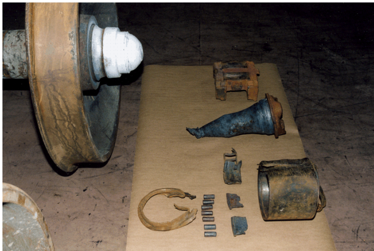
Photo 1. Roue et fusée d'essieu (R-2) et une partie des morceaux récupérés

Les morceaux récupérés du roulement à rouleaux (voir la photo 1) et des essieux montés adjacents (positions 1 et 2) ont été envoyés au Laboratoire technique du BST à Ottawa (Ontario) pour y être examinés et analysés plus en détail (rapport LP 093/2005).