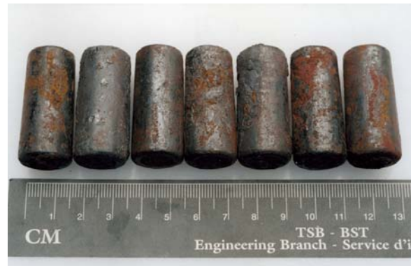
Photo 3. Rouleaux internes du roulement R-2