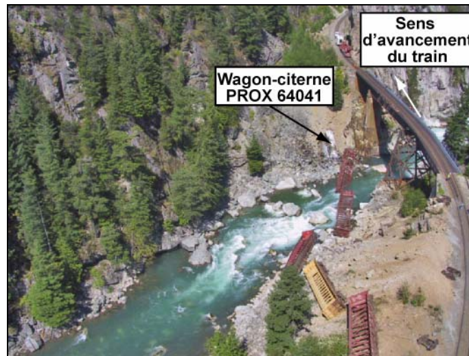
Photo 1. Position du wagon-citerne après le déraillement

wagon-tombereau vide servant au transport de copeaux, se sont arrêtés sur le côté après avoir déraillé. Le 12 e wagon, un wagon-tombereau vide servant au transport de copeaux, est resté à la verticale, et seul son bout B 4 (nord) a déraillé.