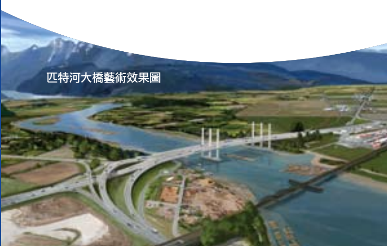
匹特河大橋藝術效果圖

以上是APGCI推動智慧交通系統的幾個例子，其目的在於改善流量、減少氣體排放、以及提高日益增大的貿易量所經過社區的生活品質。