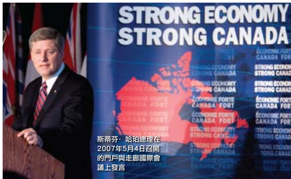
斯蒂芬·哈珀總理在2007年5月4日召開的門戶與走廊國際會議上發言

在2007年5月4日召開的門戶與走廊國際會議上，哈珀總理宣佈8億加元的APGCI資金將用於卑詩省，以認可該省的戰略角色。在十個新的APGCI專案中，我們網站上有全部細節。