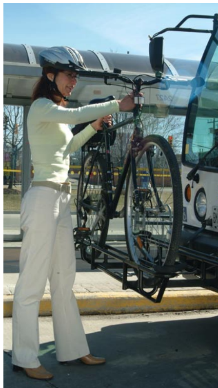
Autobus iXpress munis de supports à bicyclettes.