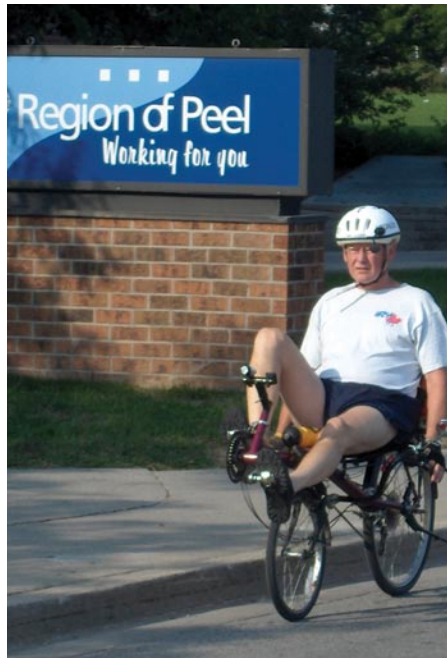
La région de Peel soutient deux associations Smart Commutes.