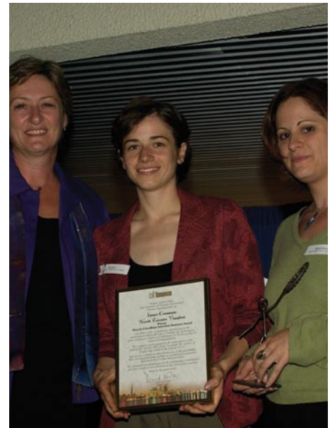
La Smart Commute North Toronto, Vaughan a été nommée à Toronto «l'entreprise de banlieue la plus conviviale pour les cyclistes» en 2005.