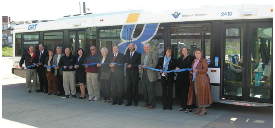
Inauguration du service.