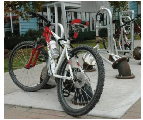
Supports à bicyclettes du centre-ville conçus par des artistes locaux.