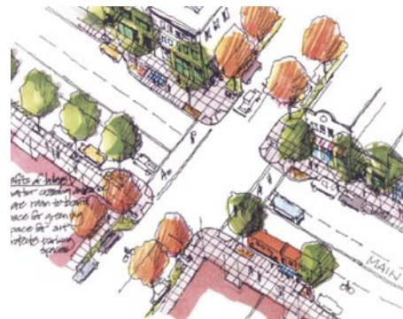
Améliorations prévues pour les piétons et la priorité au transport en commun à une intersection de la rue Main.