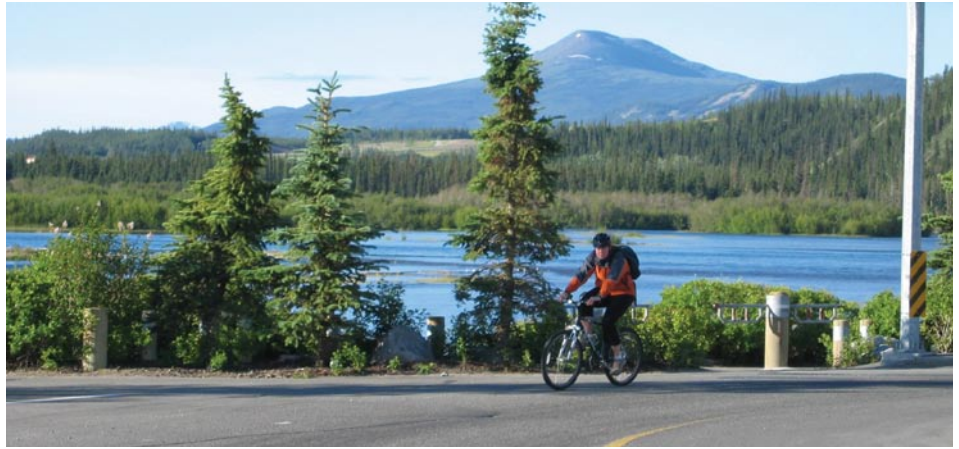
Un des nombreux cyclistes navetteurs de Whitehorse.