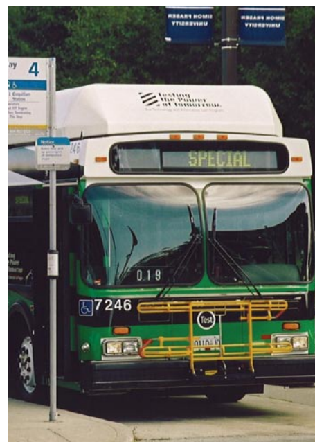
Autobus hybride en service.