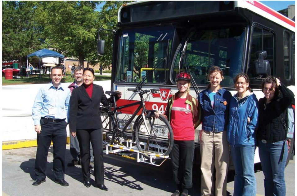
Événement cycliste à l'Université York organisé par la Smart Commute North Toronto, Vaughan.