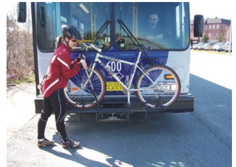
Tous les autobus MetroLink possèdent des supports à bicyclettes.