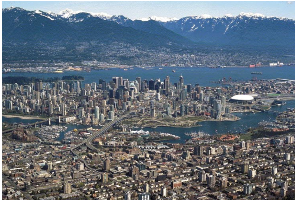
Six projets sont situés partout dans la région du Grand Vancouver.