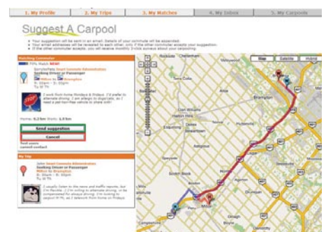
Site Web du jumelage de covoiture de l'initiative Carpool Zone.