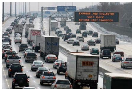
Smart Commute combat la congestion de la circulation dans la région du Grand Toronto et la ville de Hamilton.