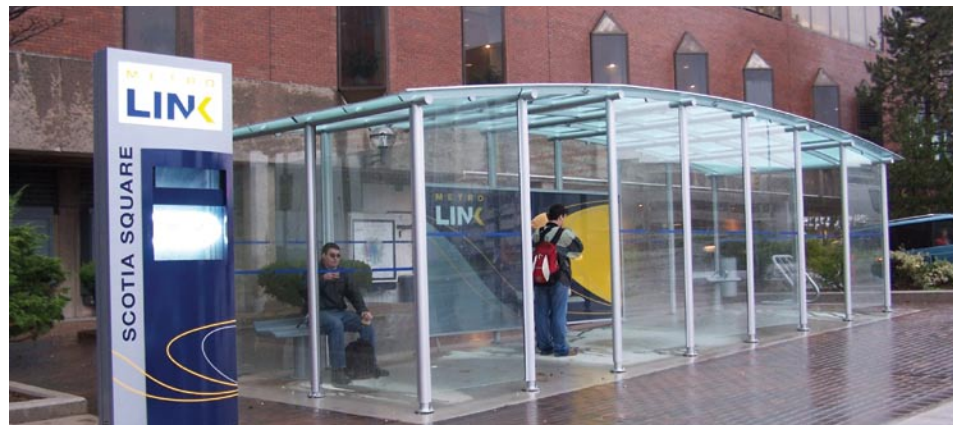
Une station au centre-ville de Halifax.