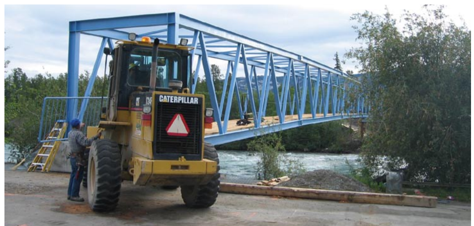
Passerelle pour piétons du centenaire du club Rotary en construction.