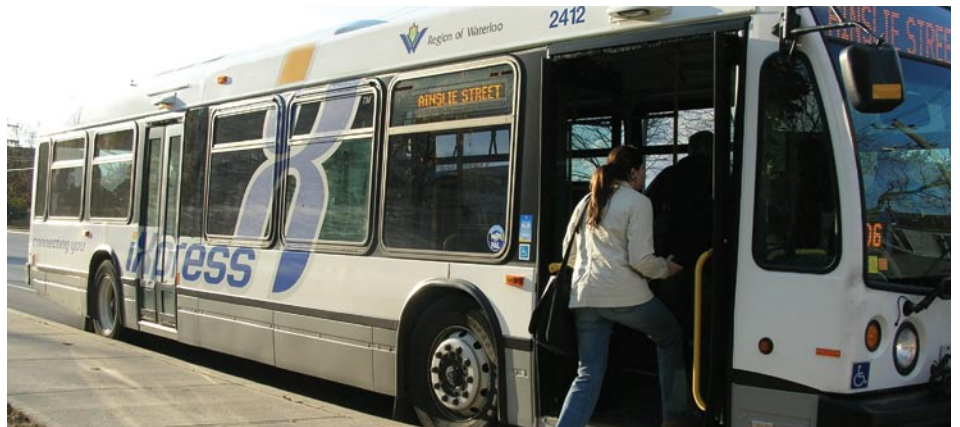
Passagers qui embarquent à la station de la Wilfrid Laurier University.