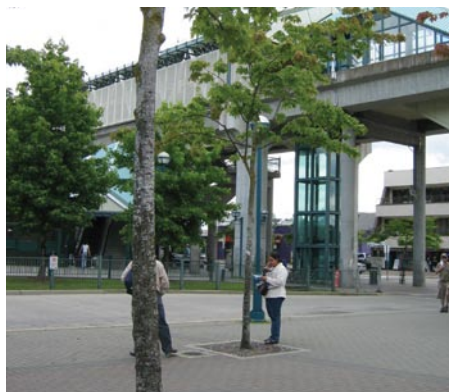
Site du village urbain à la station du SkyTrain Surrey Central.