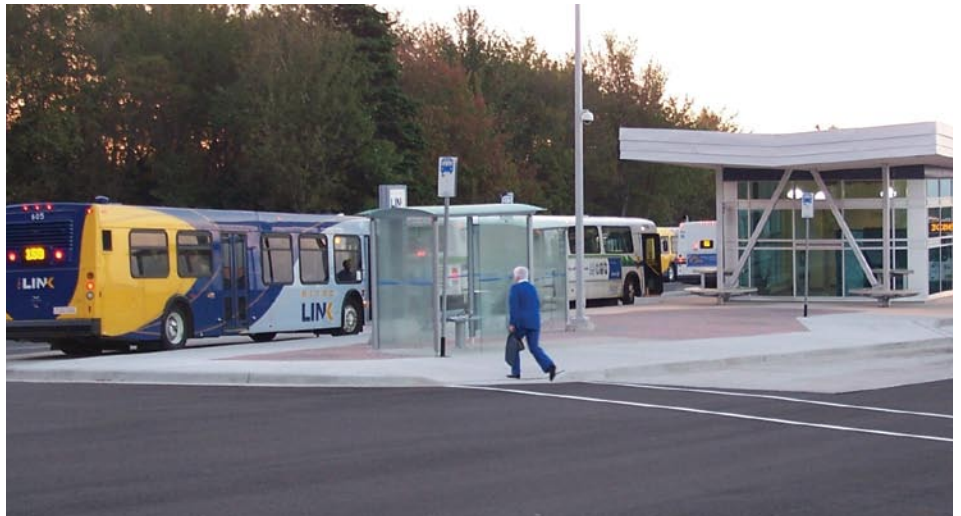
La gare à Portland Hills.