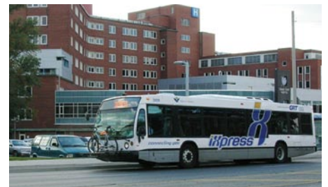
Les hôpitaux représentent l'une des principales destinations assurées par le service iXpress.