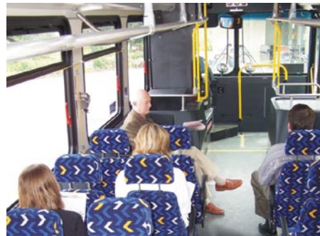
À l'intérieur d'un autobus MetroLink.