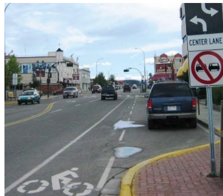
Fourth Avenue reconfigurée avec des pistes cyclables réservées et des voies réduites.