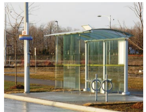
Arrêt du iXpress avec un abri pour les passagers, des bancs, de l'éclairage et des supports à bicyclettes.