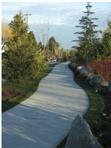
Une partie de la route écologique de Central Valley.