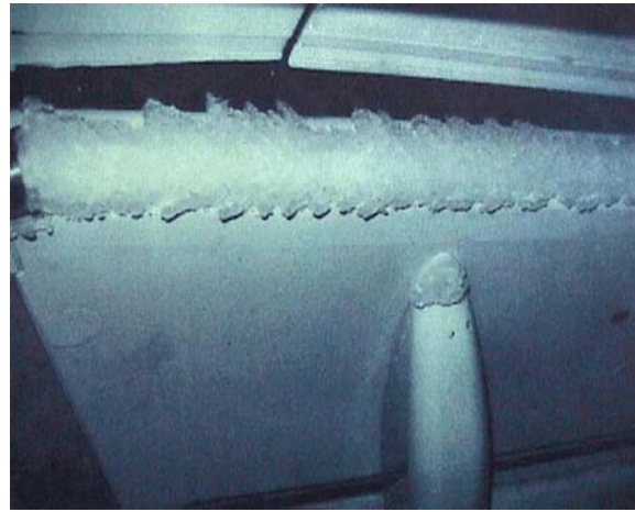
Photo 1. Accumulation de givre sur les bords d'attaque des volets principaux d'un Airbus A321 au cours de l'événement survenu en décembre 1998

En décembre 1998, deux événements similaires se sont produits sur un Airbus A321 d'un exploitant étranger se posant en configuration CONFIG FULL dans des conditions givrantes. Les oscillations en roulis avaient été attribuées à une accumulation de givre, surtout sur les bords d'attaque des volets, au niveau de la fente entre les volets principaux et le caisson de voilure. Parce que les volets principaux des Airbus A320 et A321 sont similaires et qu'aucun événement de cette nature n'avait été signalé pour les Airbus A320, on avait estimé que les conditions givrantes avaient causé les événements, et aucune modification aux appareils n'avait été jugée nécessaire. Même si les volets principaux des Airbus A320 et A321 sont similaires, la conception de leurs volets est différente. L'Airbus A321 est équipé de volets à double fente, tandis que l'Airbus A320 a des volets à fente unique.