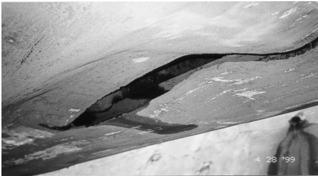
Avaries causées à la citerne de ballast liquide no 5.