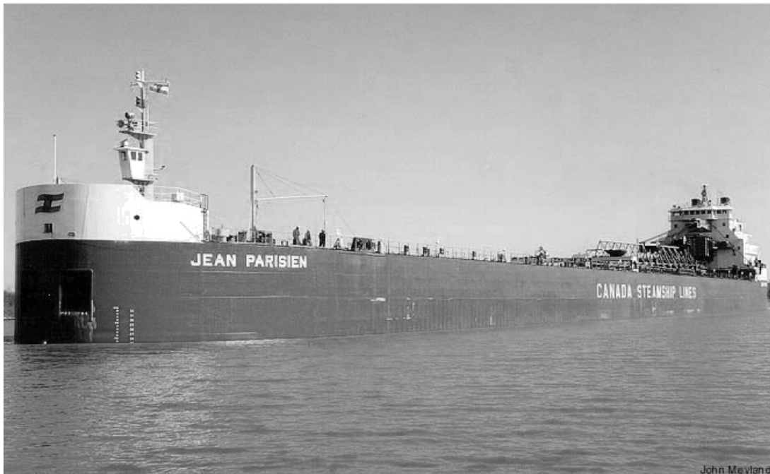
Le «JEAN PARISIEN»