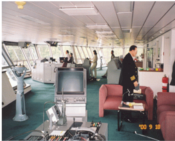
Photo 3. Configuration de la passerelle — Spirit of Vancouver Island

Le traversier est doté d'un modèle de passerelle intégrée qui applique les principes de l'ergonomie. L'officier qui dirige la manoeuvre prend place dans le fauteuil de bâbord à la console centrale, d'où il a accès, parmi d'autres instruments, au radar, aux commandes des machines et à l'équipement de communication. L'officier de navigation est assis immédiatement à tribord de l'officier qui dirige la manoeuvre et il se sert d'un radar et du VHF pour informer l'officier dirigeant la manoeuvre de tous les éléments utiles pour la navigation (dangers pour la navigation, trafic maritime, communications radio, etc.). Le champ de vision vers l'avant et de chaque côté de la passerelle est optimisé par de nombreuses vitres.