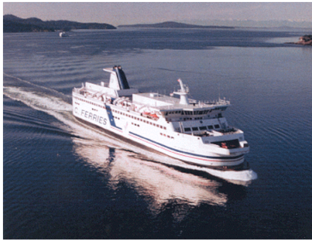
Photo 1. Le Spirit of Vancouver Island