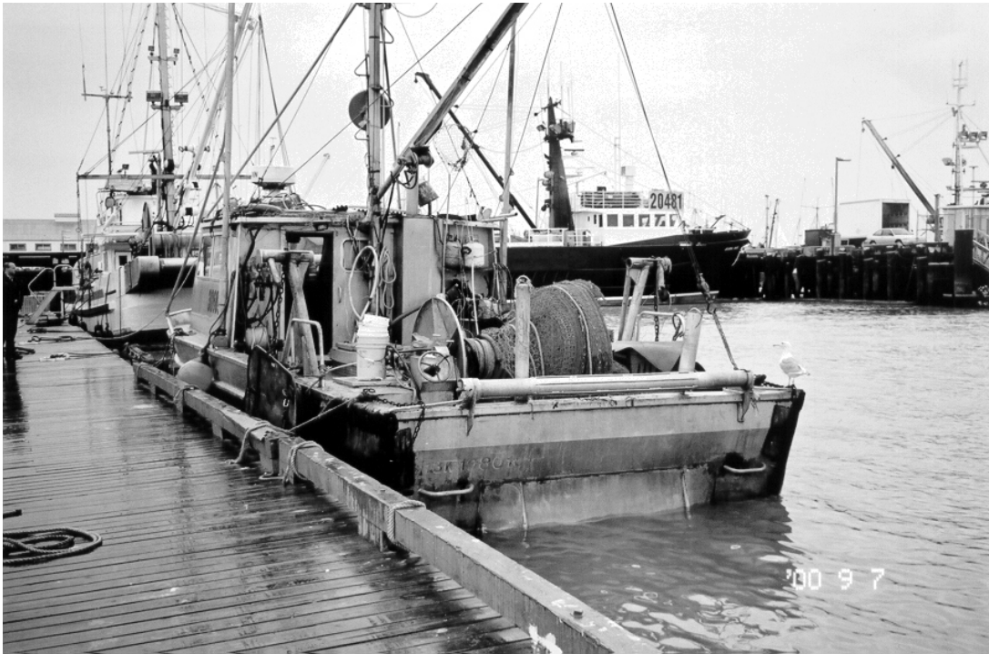
Photo 3 - Vue du pont arrière