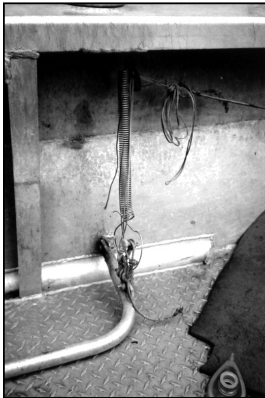
Photo 4 - Dispositif d'arrêt à distance (actionné par relâchement de la pression) déconnecté