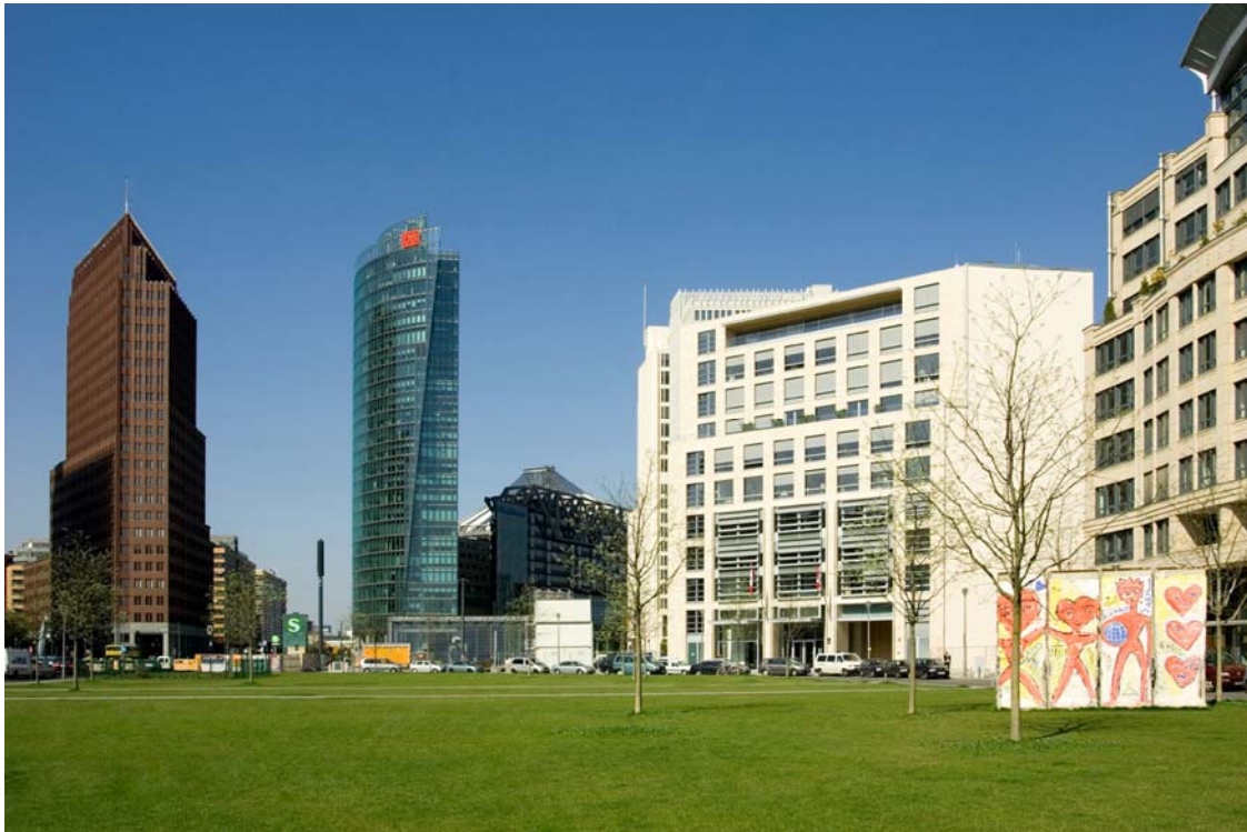
Bild 1 Die neue Botschaft von Kanada am Leipziger Platz

Das neue Gebäude der Botschaft von Kanada in Berlin ist ein markanter Bestandteil des zukünftigen Gebäudekomplexes an der Nordwest-Ecke des Leipziger Platzes. Das so genannte "Kanada-Haus" am Leipziger Platz 17 wurde als ein Public-Private-Partnership Projekt gebaut und beherbergt die Botschaft von Kanada sowie Wohn – und Büroflächen. Das neue Botschaftsgebäude, welches im April 2005 offiziell eröffnet wurde, erlaubt Fußgängern durch eine Passage von der Ebertstraße zum Leipziger Platz zu gelangen.