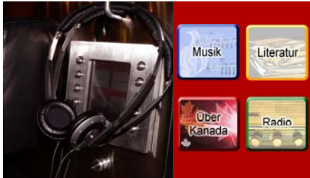
Bild 7 Hörstationen mit Menüführung

An insgesamt acht Hörstationen können die Besucher kanadische Musik aller Stilrichtungen hören.