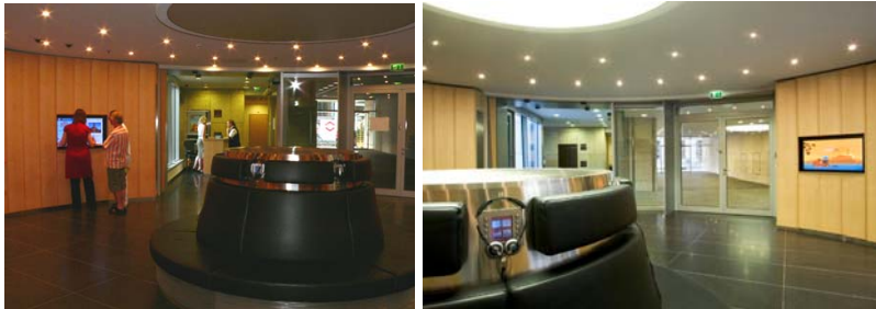
Bild 5,6 Interaktive Plasmabildschirme mit SmartBoard Technologie

drei interaktiven Plasmabildschirmen , die in die Holz getäfelten Wände eingelassen sind.