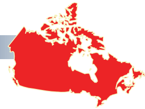
Figure 1 : Collectivités participantes 9