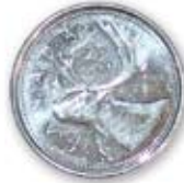
Vingt-cinq sous (25 cents) 0,25 $