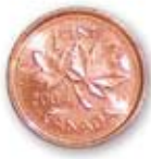
Sous (1 cent) 0,01 $