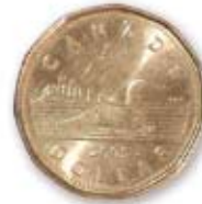
Huard (1 dollar) 1,00 $