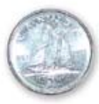
Dix sous (10 cents) 0,10 $