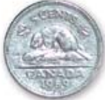
Cinq sous (5 cents) 0,05 $