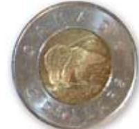
Deux dollars (2 dollars) 2,00 $