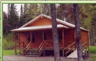
Chalet Secteur 10 Lac Matane 3 Situé à environ 12 km du secteur