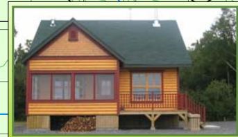
Chalet Secteur 16 Rivière Matane 3 Situé à environ 10 km du secteur