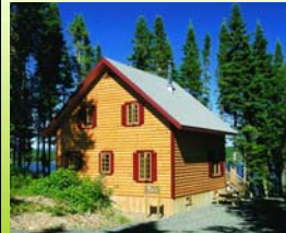
Chalet Sector 19 Presqu'île 5 Situé à environ 10 km du secteur

Réalisation: Décembre 2007 Conçu par: Robin Plante Dessiné par: Christina Ross Réserve Faunique de Matane (418) 562-3700