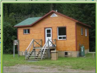
Chalet Secteur 22 Rivière-à-la-Truite 5

Réalisation: Décembre 2007 Conçu par: Robin Plante Dessiné par: Christina Ross Réserve Faunique de Matane (418) 562-3700