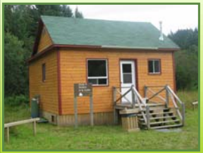
Chalet Secteur 23 Rivière-à-la-Truite 4