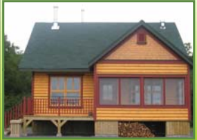
Chalet Sector 25 Étang-à-la-Truite 1

Superficie de 27.00 kilomètres carrés Projection UTM - Zone 19, NAD 83