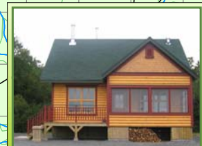
Chalet Secteur 28 Simoneau 1 Situé à environ 4 km du secteur

Réalisation: Décembre 2007 Conçu par: Robin Plante Dessiné par: Christina Ross Réserve Faunique de Matane (418) 562-3700