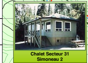
Chalet Secteur 31 Simoneau 2

Réalisation: Décembre 2007 Conçu par: Robin Plante Dessiné par: Christina Ross Réserve Faunique de Matane (418) 562-3700