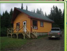
Chalet Secteur 32 Faribault

Secteur 35 Auberge de Montagne (Protégé) Le Huisseau Bascon