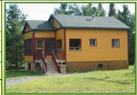
Chalet Secteur 6 Lac Matane 2 Situé à environ 11 km du secteur