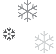
Camp rustique l'Alucite