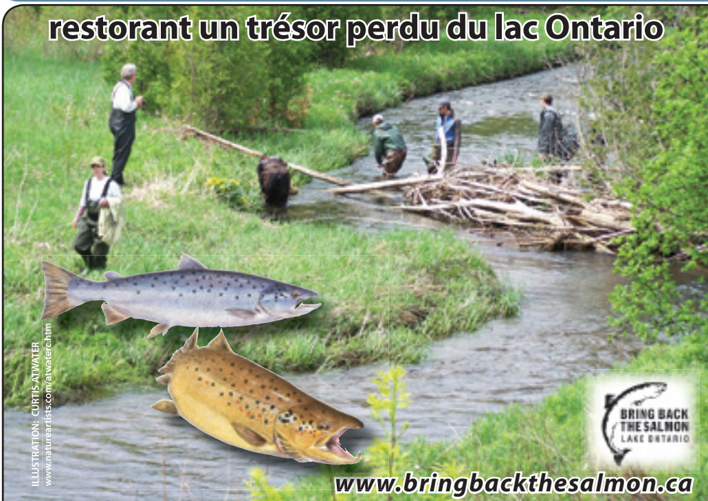
ILLUSTRATION: CURTIS ATWATER www.natureartists.com/waterch.htm