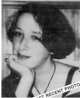
Recent Photo Photo la plus récente