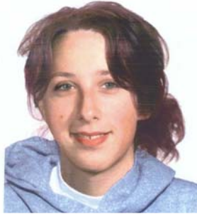
Age Enhanced Photo L'âge a été simulé sur cette photo