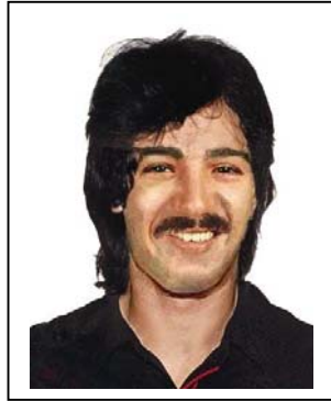
Age Enhanced Photo L'âge a été simulé sur cette photo