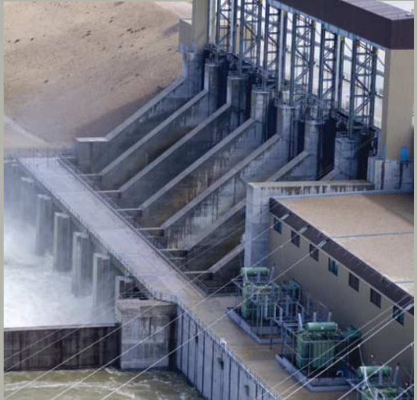
La centrale de Limestone, illustrée ci-dessus, est la plus grande centrale électrique de Manitoba Hydro, avec une puissance installée de 1 250 MW. La construction de la nouvelle centrale de Wuskwatim, d'une puissance de 200 MW, est maintenant en cours et devrait prendre fin en 2011.