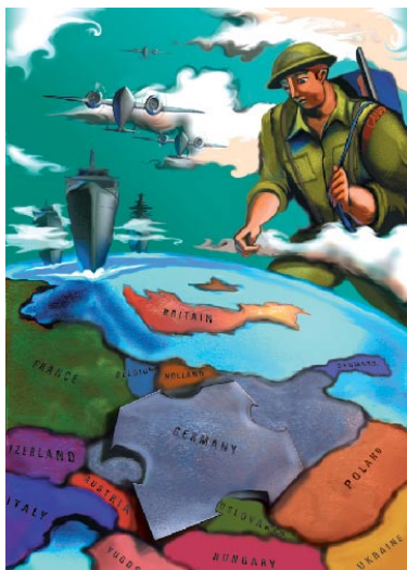
Le Canada outre-mer

www.cbc.ca/news/background/ve-day/correspondent.html (en anglais seulement) http://www.cmhg.gc.ca/html/glossary/default-fr.asp?letter=W&t=&page=1 www.warmuseum.ca/cwm/newspapers/information_f.html www.journalism.ubc.ca/thunderbird/archives/2002.02/afghanistan.html (en anglais seulement) www.canada.com/topics/news/features/afghanistan/story.html?id=1f29d9bd3499-4ec4-841f-83e267c65aad&k=73423&p=3 (en anglais seulement) http://www.civilisations.ca/pub/pub011.html www.cbc.ca/news/reportsfromabroad/murray/20000529.html (en anglais seulement) www.publicaffairs.ubc.ca/ubcreports/2003/03feb06/flak_jacket.html (en anglais seulement)