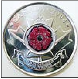
Pièce de 25 cents de circulation, le Coquelicot - la première pièce de circulation colorée au monde