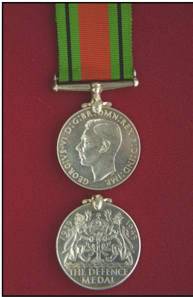
Médaille de la Défense de la Grande-Bretagne