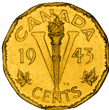
Tombac, pièce de cinq cents, 1943.

Beaucoup de choses à propos de la guerre et des événements qui l'entourent sont symboliques. Les symboles jouent un rôle important dans l'évolution de tout pays ou de toute société. En plus de revêtir une signification codifiée, le symbole constitue une image représentative du pays. Le symbole communique aussi un message. En période de guerre ou de paix, l'armée d'un pays emploie des objets qui font office de symboles, par exemple, des drapeaux, des hérauts et des étendards. Différentes armes revêtent des symboles, comme la configuration de la poignée d'une épée, ou un motif gravé dans la lame d'un couteau. Les médailles et les dossards portés par les militaires, même leur uniforme, représentent leur rang et leurs réalisations, indiquant notamment s'ils ont suivi un certain cours ou programme, accompli un acte héroïque,