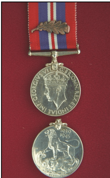
Médaille de la Guerre de 1939-1945

ou réalisé un exploit, rempli des obligations ou assumé certaines responsabilités pour atteindre un certain rang. Où que nous regardions dans la société, nous voyons un monde rempli de symboles, qu'il s'agisse d'un icône à l'ordinateur ou d'un message texte. Dans le domaine militaire et dans le théâtre de la guerre, le symbolisme est omniprésent.