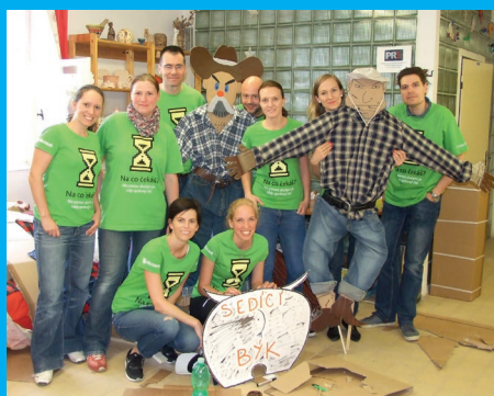
Dobrovolnictví zaměstnanců Microsoftu v Thomayerově nemocnici v Praze