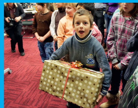
Vánoce pro děti z dětského domova v Nechanicích