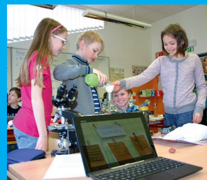
Moderní hodina v referenční škole v Říčanech