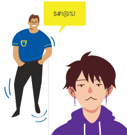
Refuser de rire ou de réagir