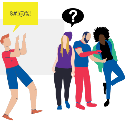
Lancer un regard interrogateur