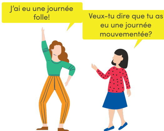
Répéter les propos entendus sans employer un langage discriminatoire