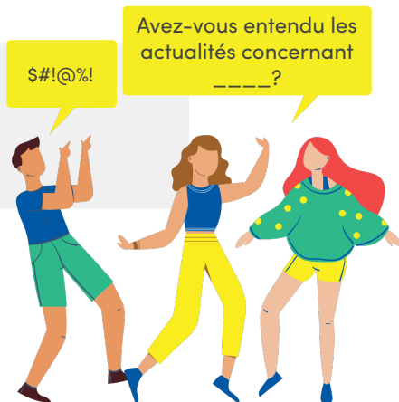
Changer le sujet avec des phrases comme