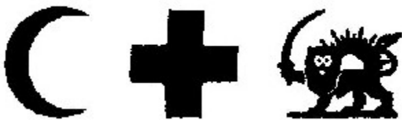
Fig. 2: Distinctive emblems in red on a white ground

2 At night or when visibility is reduced, the distinctive emblem may be lighted or illuminated; it may also be made of materials rendering it recognizable by technical means of detection.