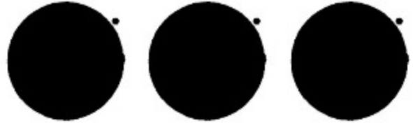
Fig. 5: Signe spécial international pour les ouvrages et installations contenant des forces dangereuses

4 De nuit, ou par visibilité réduite, le signe peut être éclairé ou illuminé; il pourra également être fait de matériaux le rendant reconnaissable par des moyens techniques de détection.