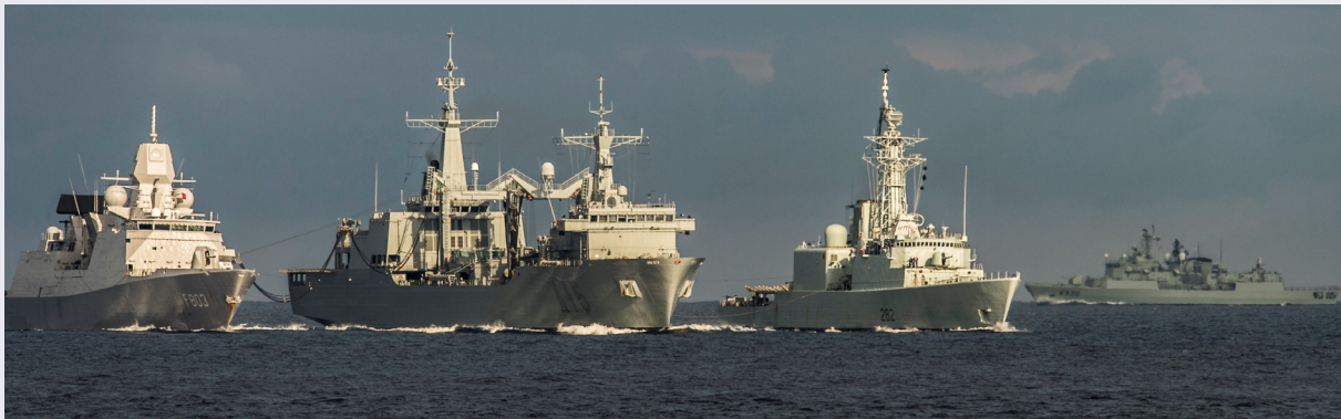
Photo : 26 octobre 2015 – Le HNLMS Tromp (à gauche) et le NCSM Athabaskan (le 3 e à partir de la gauche) effectue une opération de ravitaillement en mer (REM) avec l'ESPS Cantabria (le 2 e à partir de la gauche), pendant JOINTEX 2015 dans le cadre de l'exercice Trident Juncture 2015, le 26 octobre 2015. Le NRP Vasco de Gama (à droite) navigue en arrière-plan.

JOINTEX est une série permanente annuelle d'exercices de développement des capacités interarmées et d'entraînement collectif du MDN et des FAC. Cet exercice a pour but de démontrer les capacités du quartier général d'une force opérationnelle intégrée interarmées et multinationale par le Canada à planifier et à exécuter des opérations coalisées dans un contexte interarmées, interorganisationnel, multinational et public. Le JOINTEX est conçu pour transformer la façon dont les FAC s'y prennent pour s'entraîner, se perfectionner et s'instruire en vue d'opérations.