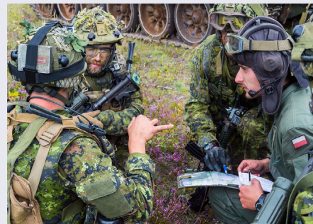
Photo : Des militaires canadiens du groupement tactique de présence avancée renforcée de l'OTAN en Lettonie coordonnent un plan avec un chef de char polonaise, le 24 août 2017, lors de l'exercice de certification au Camp Adazi, en Lettonie.

Récemment, un groupement tactique de présence avancée renforcée a été ajouté à l'opération REASSURANCE, ce qui suppose le déploiement d'environ 450 membres des Forces armées en Lettonie. Ces militaires dirigent un groupement tactique de l'OTAN composé de militaires provenant de plusieurs nations, dont l'Albanie, le Canada, l'Italie, la Pologne, la Slovaquie et l'Espagne. Ce groupement tactique fera partie de la brigade d'infanterie des forces terrestres de la Lettonie.